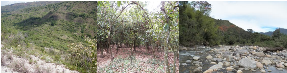
Foto 4 Tipos de vegetación: Izquierda: Arbustiva, centro: bosque multiestrata y derecha: bosque de ribera

El párrafo único del artículo 43 de la Ley 99 de 1993, establece que todo proyecto que involucre en su ejecución el uso del agua, tomada directamente de fuentes naturales, deberá destinar no menos del 1% del total de la inversión para la recuperación, preservación y vigilancia de la cuenca hidrográfica que alimenta la respectiva fuente hídrica.