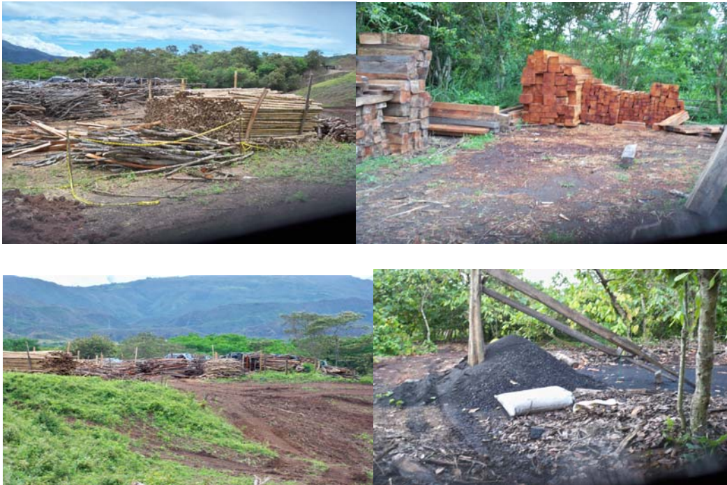
Foto 2. Aprovechamiento forestal

La Resolución 899 de 2009 establece la obligación de los puntos de control.