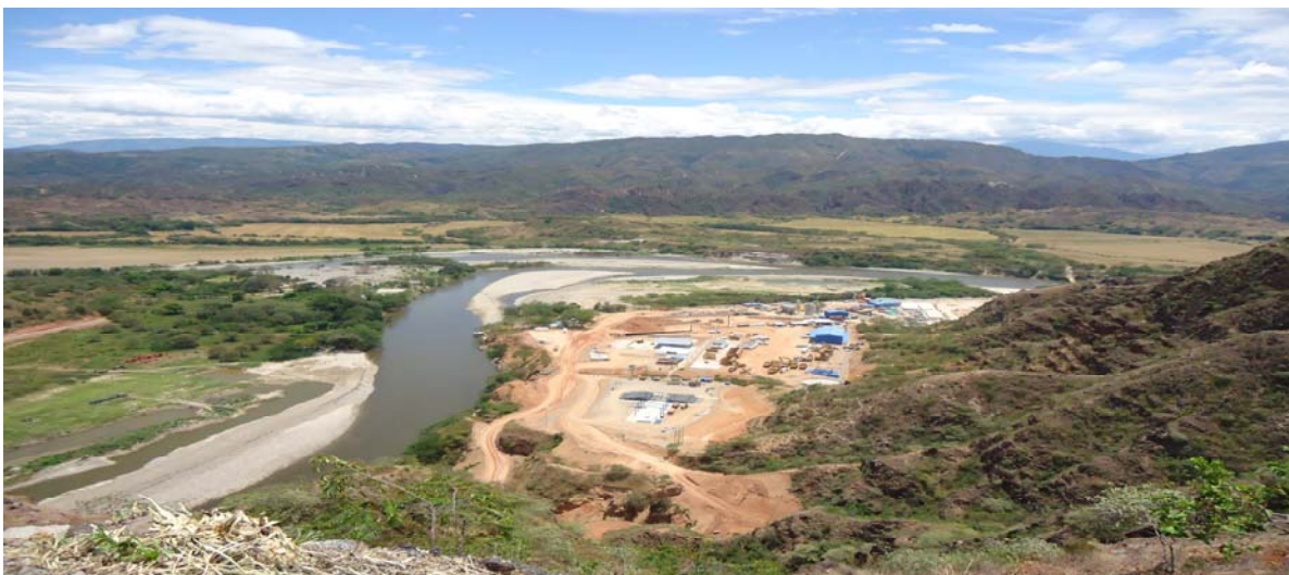
Foto 1. Panorámica proyecto Hidroeléctrico Quimbo.

La Auditoria Gubernamental practicada a la CAM se articuló con la veeduría ciudadana El Curíbano, en el tema relacionado con el proyecto Hidroeléctrico de El Quimbo.